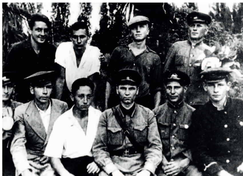
На снимке: группа молодых сочинцев, призванных на фронт в первые дни Великой Отечественной войны. Никто из них не вернулся домой.

Благодаря поисковикам города Северодвинска удалось найти его останки и установить